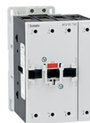
Stycznik mocy BFD150