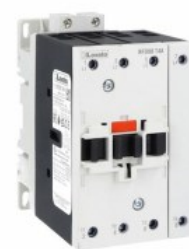
Stycznik mocy BFD80