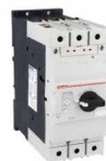
Wyłącznik silnikowy SM3R