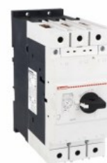
Wyłącznik silnikowy SM3R