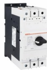
Wyłącznik silnikowy SM3R