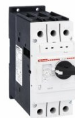
Wyłącznik silnikowy SM2R