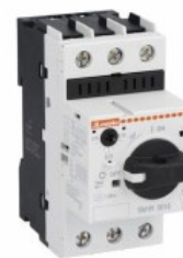
Wyłącznik silnikowy SM1R