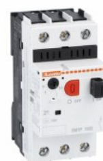
Wyłącznik silnikowy SM1P