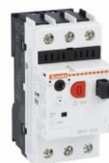
Wyłącznik silnikowy SM1P