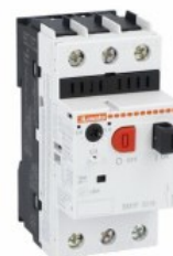
Wyłącznik silnikowy SM1P