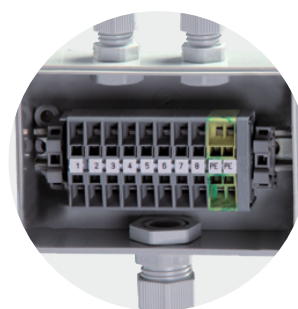
Budowa zoptymalizowana pod listwy zaciskowe