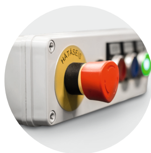
Zaprojektowane pod zabudowę przycisków