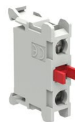
Zestyki montowane na tylnej pokrywie obudowy LPZ LPXCB