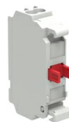
Zestyki z zaciskami sprężynowymi LPXCS