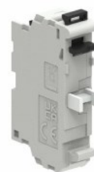
Zestyki – bez adaptera montażowego LPXC