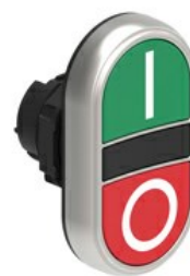
Przyciski dwuklawiszowe z samoczynnym powrotem – dwa kryte LPCB71