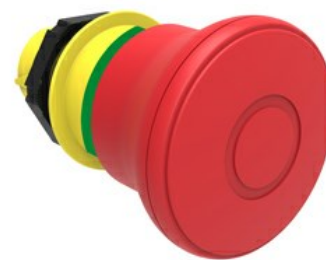
Przycisk do zatrzymania awaryjnego (grzybki), blokowany, odblokowanie przez pociągnięcie Ø 40 mm/1,6" LPCB674