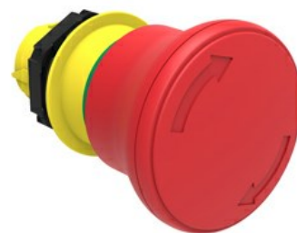
Przycisk do zatrzymania awaryjnego (grzybki), blokowany, odblokowanie przez obrót Ø 40 mm/1,6" LPCB664