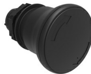
Przycisk do zatrzymania awaryjnego (grzybki), blokowany, odblokowanie przez obrót Ø 40 mm/1,6" LPCB634