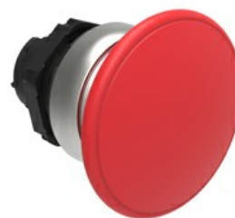
Przycisk do zatrzymania awaryjnego (grzybek), samoczynny powrót, Ø 40 mm/1,6" LPCB614