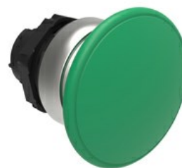
Przycisk do zatrzymania awaryjnego (grzybek), samoczynny powrót, Ø 40 mm/1,6" LPCB614