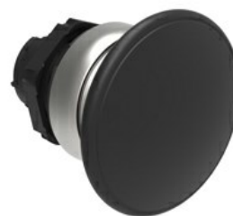
Przycisk do zatrzymania awaryjnego (grzybek), samoczynny powrót, Ø 40 mm/1,6" LPCB614