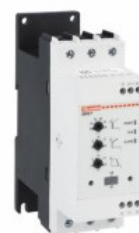
Softstart - wersja zaawansowana ADXNP Asynchroniczny trójfazowy