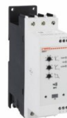
Softstart - wersja zaawansowana ADXNP Asynchroniczny trójfazowy