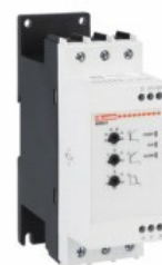
Softstart - wersja podstawowa ADXNB Asynchroniczny trójfazowy