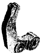
Dźwignia napędu łącznika pomocniczego