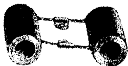
Opornik dodatkowy forsujący

67.02-12 – SU 0/1 67.02-28 – SU 2/3 67.02-43 – SU 4 67.02-57 – SU 5 67.02-70 – SU 6