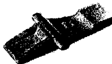
Styk ruchomy rozwierny 67.02-3 – SU 0/1 67.02-23 – SU 2/3 67.02-38 – SU 4 67.02-52 – SU 5 67.02-65 – SU 6