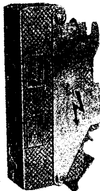
Komora łukowa 67.02-4 – SU 0/1 67.02-24 – SU 2/3 67.02-39 – SU 4 67.02-53 – SU 5 67.02-66 – SU 6