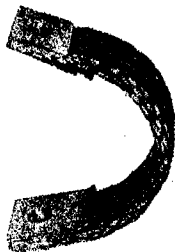
Połączenie podatne 67.02-5 – SU 0/1 67.02-25 – SU 2/3 67.02-40 – SU 4 67.02-54 – SU 5 67.02-67 – SU 6