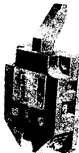
Łącznik forsujący Ł.P-5 67.02-19 – SU 0 ÷ 6

67.02-16 – SU 0/1 67.02-33 – SU 2/3 67.02-60 – SU 4 67.02-73 – SU 5 67.02-76 – SU 6